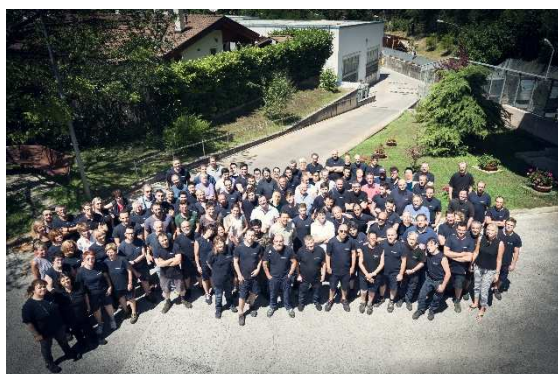
Figure professionali (sia per ragazze che ragazzi, f/m): disegnatore tecnico, elettrotecnico, mecatronico, ingegnere, impiegato tecnico e amministrativo, .....

dopo il benvenuto e la presentazione aziendale potrai vedere come nasce e si sviluppa una cerniera. Ti mostreremo la varietà dei nostri prodotti e delle nostre attività e tu stesso potrai viverlo in prima persona! Attraverso la visita in produzione potrai, inoltre, muovere un robot e vedere come si ritaglia un metallo con il laser.